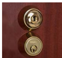
Laiton chromé brossé Laiton verni