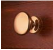
Laiton chromé brossé Laiton verni