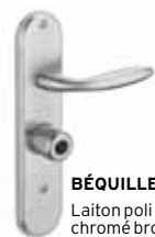
BÉQUILLE Laiton poli ou chromé brossé