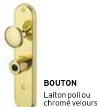
BOUTON Laiton poli ou chromé velours