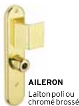
AILERON Laiton poli ou chromé brossé